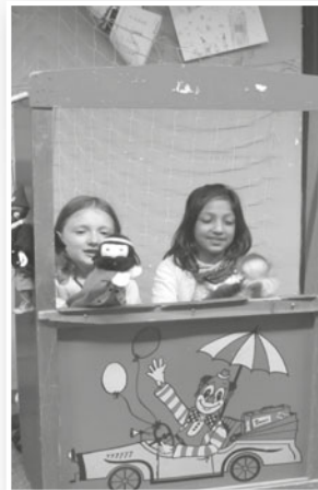
děti při hraní maňáskového divadla