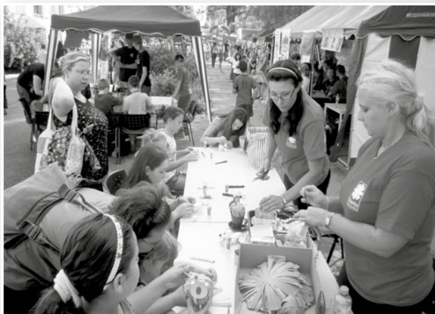
pracovnice při akci AHOJ PRÁZDNINY

Sociální pracovnice v průběhu celého roku spolupracovaly s praktikanty z různých škol a dobrovolníky. Dále byla spolupráce se subjekty ve městě Frýdek-Místek a to Městskou policií, s pracovníci odboru sociální prevence a sociální ochrany dětí, Sociální asistencí a Střediskem volného času Klíč, Poradnou pro ženy a dívky, stále jsme členy lokálního partnerství. Sociální pracovnice se účastnily nejrůznějších veřejných akcí převážně zaměřených na volný čas dětí a to Indiánské odpoledne aneb hon na bizona, Pohádková první pomoc s Českým Červeným křížem a Ahoj školo v rámci akce „Prázdniny ve městě“.