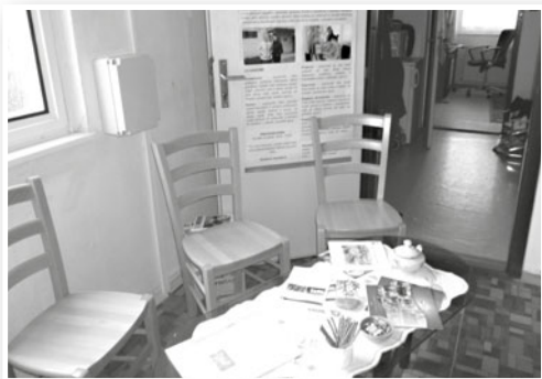
akce „Kavárna čtvrté patro“

Pracovnice s vedoucím se pravidelně setkávaly s pracovní skupinou pro osoby s psychickým onemocněním – CASE POINT v rámci komunitního plánování ve městě. Skupina je tvořena pracovnicemi odboru sociálních služeb Magistrátu Frýdek-Místek a zástupců poskytovatelů sociálních služeb působících ve Frýdku-Místku. Dlouhodobým cílem pracovní skupiny je propojit zdravotní a sociální služby pro osoby s psychickým onemocněním. V současné době se pracovní skupina bude věnovat mapování potřeb v oblasti tzv. sociálního bydlení u osob s psychickým onemocněním. V loňském roce se v lednu podařilo sejit s odbornými lékaři (psychiatry) z Frýdku-Místku a navázat s nimi spolupráci a nadále v průběhu roku oslovit praktické lékaře pro dospělé s nabídkou spolupráce.