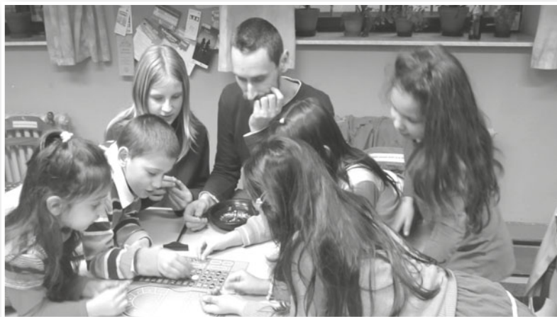
děti při hraní her

Jako každý rok, i letos probíhaly v klubu průběžné i souvislé praxe studentů VOŠ a VŠ. Rozšířila se spolupráce s dobrovolníky.