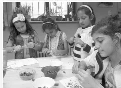
výroba šípkové marmelády

Akce - jednodenní výlety, vícedenní pobyty, prezentační akce (vystoupení), společensky prospěšné aktivity (Tříkrálová sbírka), kulturní akce a sportovní turnaje a utkání.