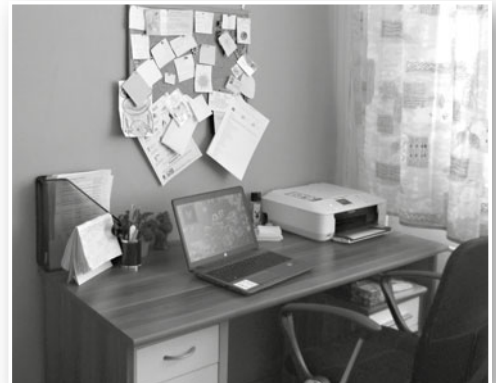
Kancelář Terénní služby ZOOM