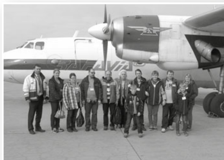
Exkurze na mošnovském letišti