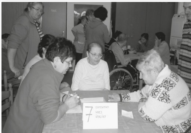
jedna z disciplín Olympiády

Pro klienty organizujeme také jednodenní výlety s cílem poznat kulturní památky a výstavy, návštěvy kin a divadel, pravidelné návštěvy bazénu a jednou ročně pořádáme 6 denní ozdravný pobyt. Pobyt a strava je hrazená klientem a to ve výši dle aktuálního ceníku. 1x měsíčně probíhá na Oáze mše svatá a klienty také doprovázíme na mše dle jejich vyznání.