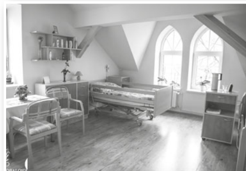
Vnitřní prostory odlehčovací služby