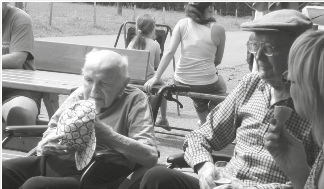
výlet do mlékárny na Čeladné

Během celého roku s klienty malujeme, vyrábíme přáníčka, ozdoby k různým příležitostem, zpíváme a rádi posloucháme hudbu a sledujeme naučné filmy a dokumenty. Pravidelně s rehabilitační pracovnící cvičíme a dle zdravotního stavu také rehabilitujeme.