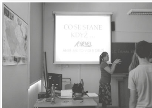
pracovnice Rebelu při přednášce na téma „Co se stane když...“

Účastnili jsme se také Dne zdraví a sociálních služeb. Pracovníci během celého roku navštěvovali různá odborná školení, která vedla ke zkvalitnění služby.