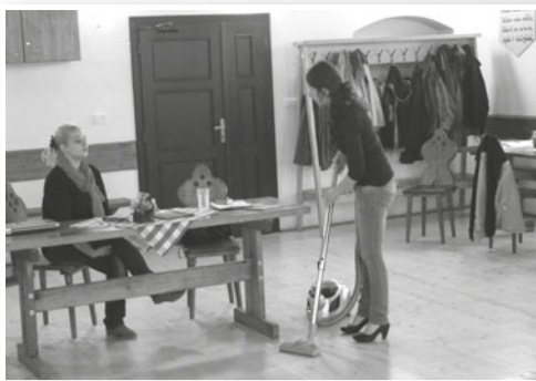
pracovnice při hraní scének „Jak nenaletět podvodníkům“