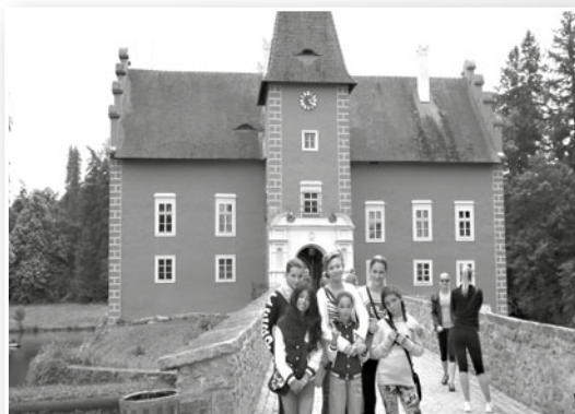
Výlet do jižních Čech