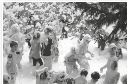
Děti v pění na dětském dopoledni