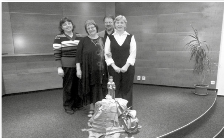
Ocenění zaměstnanci otcem biskupem

Během roku 2014 se rozšířil počet uživatelů oproti roku 2013. V péči jsme měli 146 uživatelů, u nichž jsme provedli 19 800 návštěv.