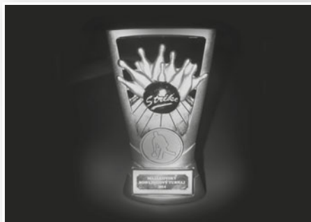
pohár pro vítěze bowlingového turnaje

V září proběhl první ročník Bowlingového turnaje, kterého se zúčastnili klienti se svými rodinnými příslušníky. Ke konci roku klienti chystali tašky pro koledníky na Tříkrálovou sbírku.