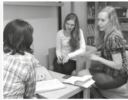
Sociální pracovnice při rozhovoru s klientem

V případě náročných životních situací vám poskytneme odbornou psychoterapeutickou podporu, jestliže např. prožíváte: