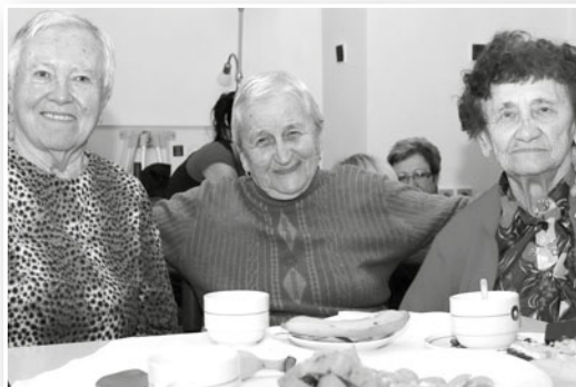
Posezení uživatelů u kávy