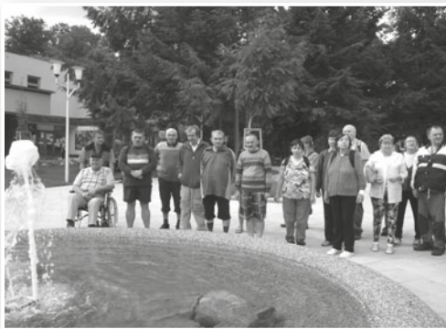
Rekondiční pobyt v Jeseníkách