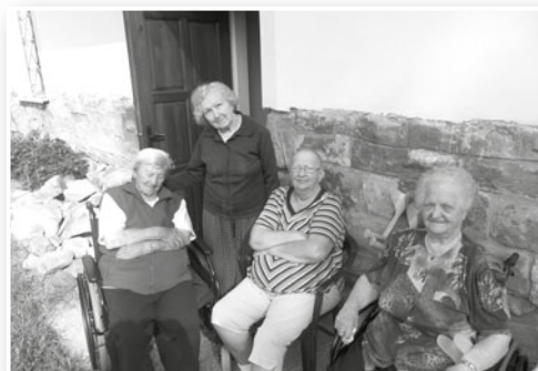
Posezení uživatelů na zahradě