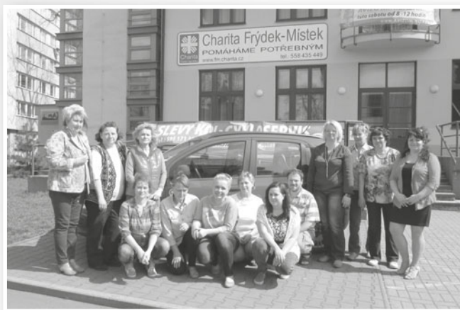
Pracovní tým pečovatelské služby

Služby jsou konkrétně určeny seniorům a dospělým lidem se zdravotním postižením a chronickým onemocněním, kteří mají sníženou soběstačnost v základních životních dovednostech, jejichž situace vyžaduje pomoc jiné fyzické osoby a kteří chtějí žít ve svém domácím prostředí.