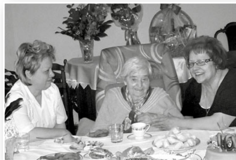
Oslava 100 let jedné uživatelky domova