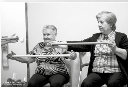
pohybové cvičení uživatelů

V průběhu roku jsme pořádali několik přednášek, např.: o Ostrově Molokaj (ostrov malomocných), přednášku o sv. Hedvice a o sv. Ludmile. Navštívilo nás několik hudebních souborů a děti z mateřských, základních a středních škol u různých příležitostí.