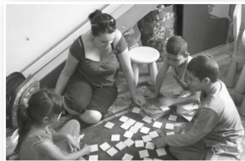
volnočasové aktivity s dětmi na ul. Míru